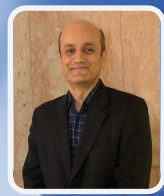
به روز رسانی شواهد مربوط به اثر واکسن ها و واریانت های جدید بر اپیدمی کووید-۱۹