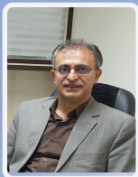
گرداننده بحث و دبیر وینار

زمان برگزاری: روز دوشنبه ۱۴ تیر ماه ساعت ۱۴ تا ۱۶