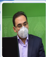
روش های تشخیص واریانت های جدید